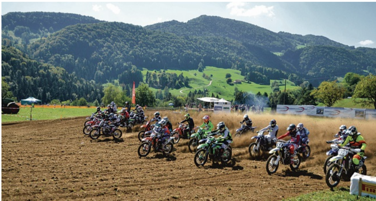
Im Reckenkien röhren wieder die Motoren: Startimpression vom Motocross Passwang.

Der Aufwand für diesen Anlass ist enorm gross und nur dank den treuen Sponsoren kann jedes Jahr ein solcher Event auf die Beine gestellt werden. Ist das Rennwochenende erfolgreich und ohne Unfälle über die Bühne gegangen, freuen sich